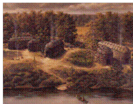
Illustration du site Mandeville, Guy Lapointe, 1988